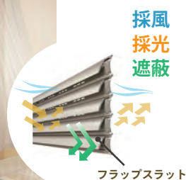
フラップスラット